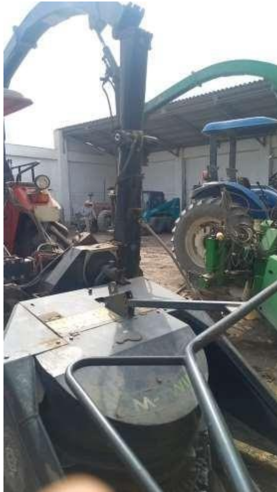
Imagen 3. Estado de la picadora de campo color negro

“Decenio de la Igualdad de oportunidades para mujeres y hombres” “Año de la Esperanza y el Fortalecimiento de la Democracia”