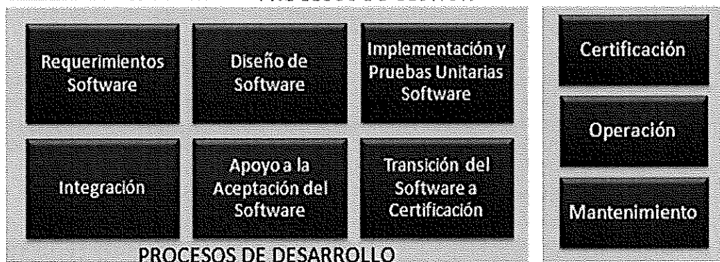
Ilustración. Metodología para el Ciclo de Vida del Software - BN

Los procesos principales de la “Metodología para el Ciclo de Vida del Software” son los que a continuación se grafican: