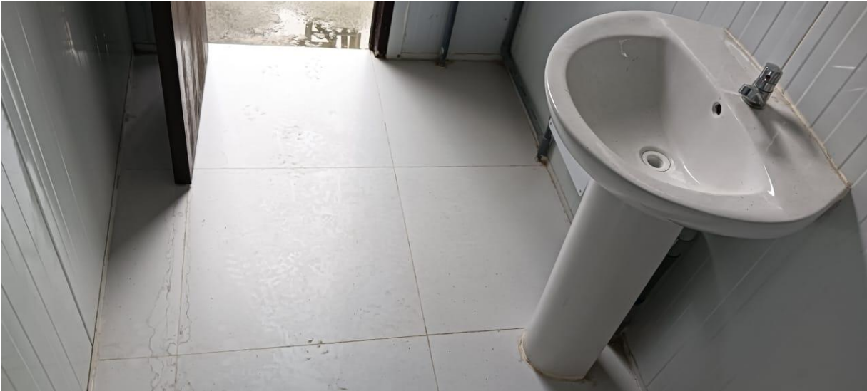
IMAGEN REFERENCIAL DEL ZÓCALO A SUMINISTRAR E INSTALAR EN TODAS LAS ÁREAS