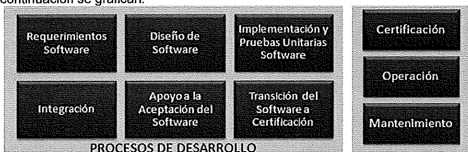
Ilustración. Metodología para el Ciclo de Vida del Software - BN

Los procesos principales de la "Metodología para el Ciclo de Vida del Software" son los que a continuación se grafican: