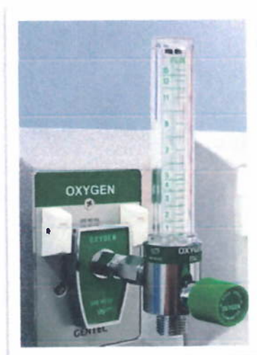
Flujómetro de Pared

GOBIERNO REGIONAL DE AREQUIPA GERENCIA DE SALUD AREQUIPA HOSPITAL CENTRAL DE MAJES - GRA