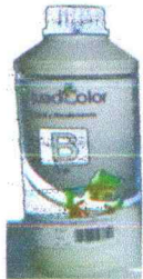
CUADRO N° 04