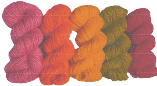
Imagen referencial :