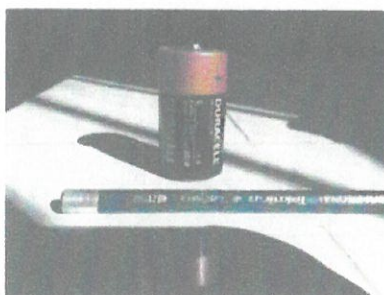
Pilas alcalinas Tipo "C" de 1,5 voltios

Two circular official stamps from the Autoridad Autónoma de Majes. The top stamp is from the 'Gerencia General' and the bottom one is from the 'Gerencia de Mantenimiento y Reparación'. Both stamps contain the acronym 'V.O.B.' and are crossed out with blue ink scribbles.