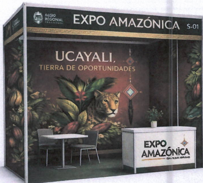
Vista frontal 3D