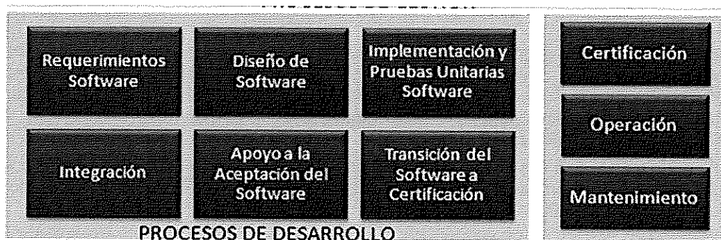
Ilustración. Metodología para el Ciclo de Vida del Software - BN

Los procesos principales de la "Metodología para el Ciclo de Vida del Software" son los que a continuación se grafican: