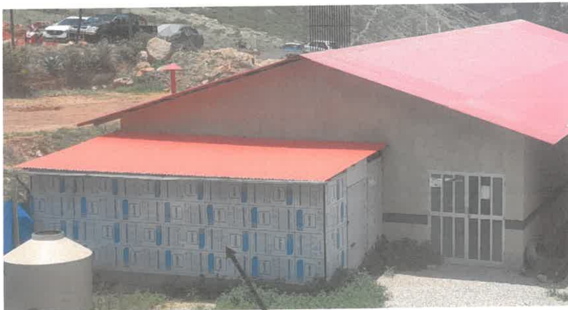
ZONA DE LAVADO DE VAJILLA