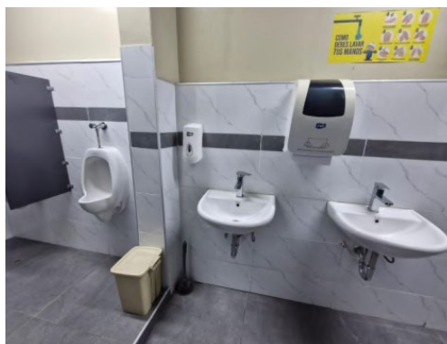
Imagen 7. Grifería y trampas de lavamanos en SS. HH de casa de máquinas.

Dicha actividad será contabilizada en el listado de metrado ejecutado por parte del contratista.