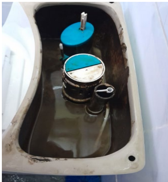
Imagen 9. Accesorios de inodoro en mal estado de SS. HH de casa de máquinas.

Dicha actividad será contabilizada en el listado de metrado ejecutado por parte del contratista.