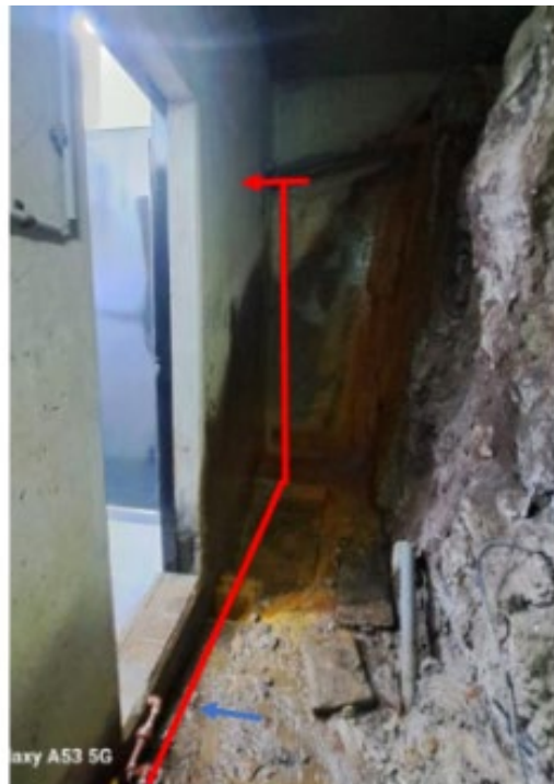
Imagen 10. Muestra de trazo de tubería.

El empalme para red del SS. HH del nivel 2963 se encuentra en el ducto de ventilación fácilmente identificable.