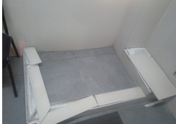
Imagen 1. Estado del SS. HH de almacén principal.