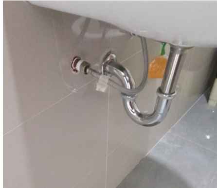
Imagen 8. Chicote en lavamanos de SS. HH casa de máquinas.

Dicha actividad será contabilizada en el listado de metrado ejecutado por parte del contratista.