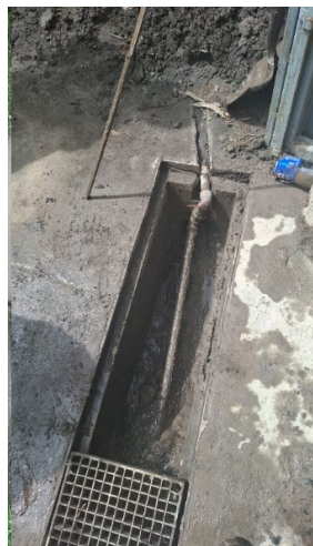
Imagen 4. Drenaje de acceso a túnel de Casa de máquinas de CH V.

La actividad consistirá en realizar actividad de limpieza y retiro de todo tipo de residuo o material que afecte el libre flujo del caudal, asimismo comprende la limpieza en toda la zona colindante con el drenaje de acceso.