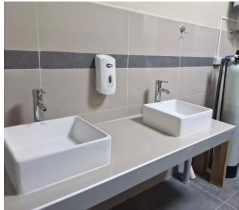
Imagen 6. Grifería en SS. HH de sala de mando.

Dicha actividad será contabilizada en el listado de metrado ejecutado por parte del contratista.