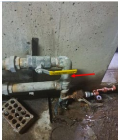
Imagen 11. Conexión a red existente en caverna.

Se instalará un accesorio que permita instalar una nueva red acoplando a la tubería de pvc existente (que se muestra en la imagen N°11) que se encuentra en la caverna del SS. HH del nivel 2955. Para el adecuado control de esta red, se instalará una llave de paso para la nueva red PVC.