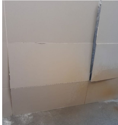
Imagen 5. Estado del SS. HH casa de máquinas.

Se realizará el retiro de porcelanato conforme a lo establecido en el numeral 02.01 del presente documento.