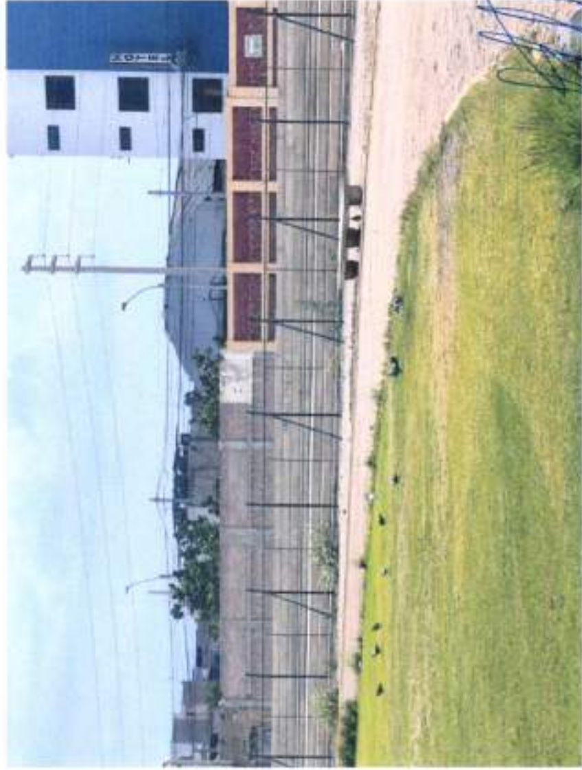
CERCO PERIMETRICO CON MALLA COCADA

[Handwritten signature] INGENIERO CIVIL C.P. 100-07307