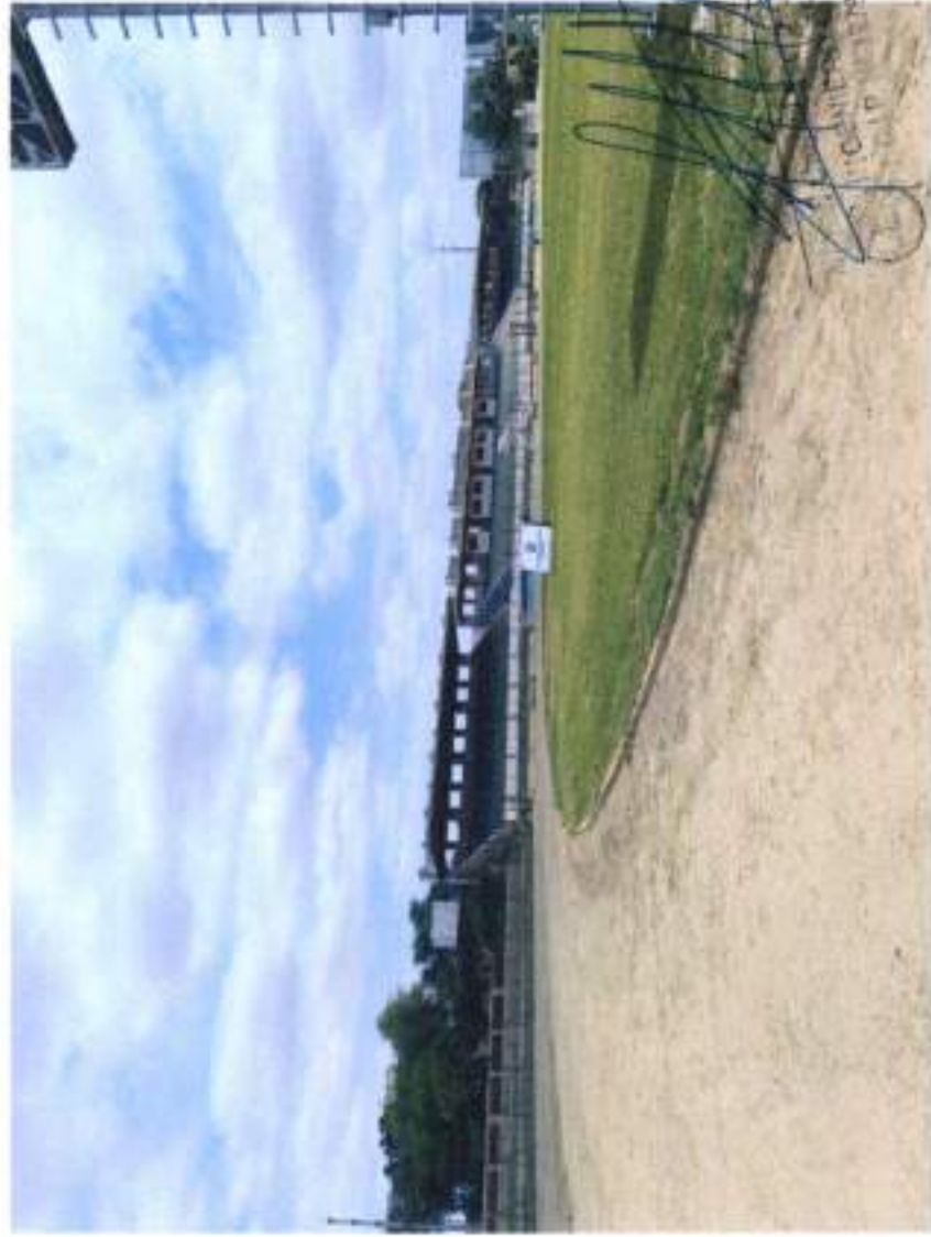
CERCO PERIMETRICO CON MALLA COCADA