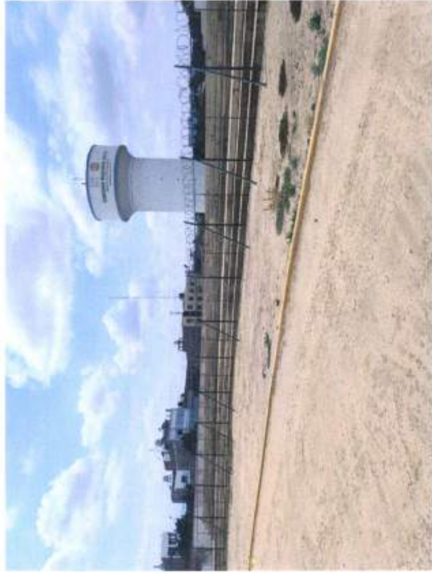
CERCO PERIMETRICO CON MALLA COCADA