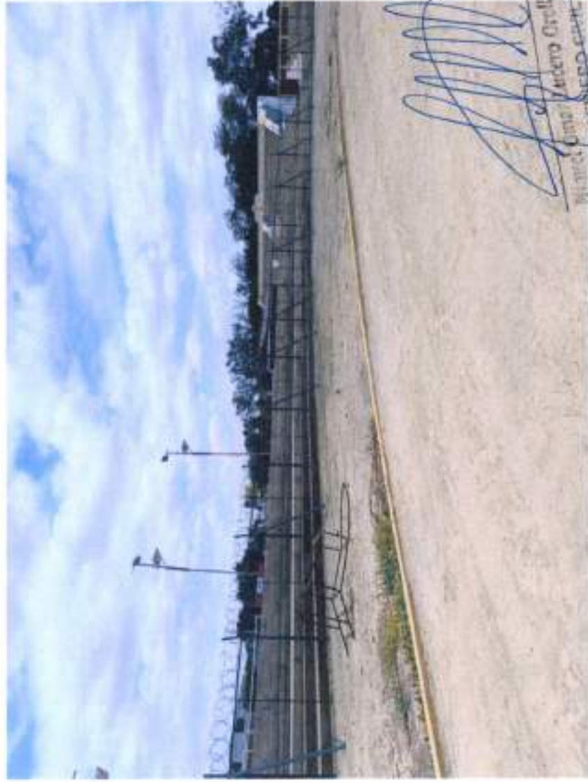
CERCO PERIMETRICO CON MALLA COCADA