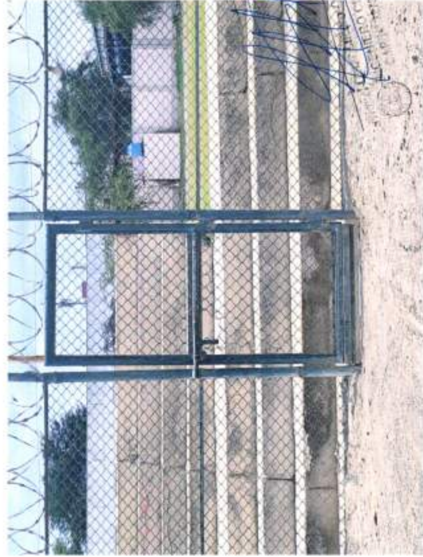
CERCO PERIMETRICO CON MALLA COCADA