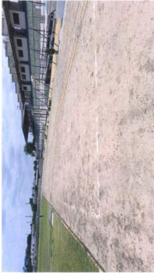
CERCO PERIMETRICO CON MALLA COCADA