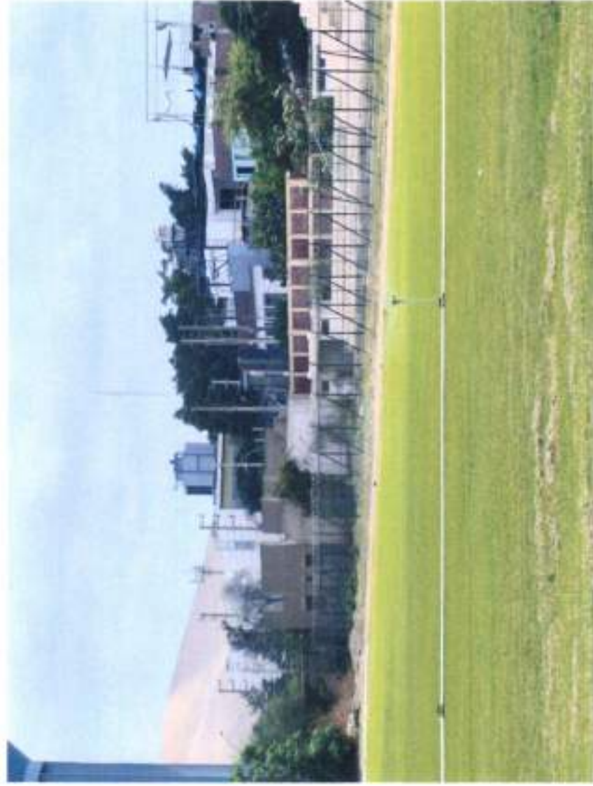
CERCO PERIMETRICO CON MALLA COCADA