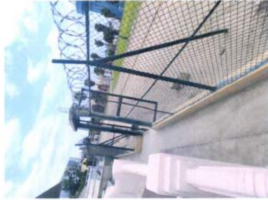
CERCO PERIMETRICO CON MALLA COCADA