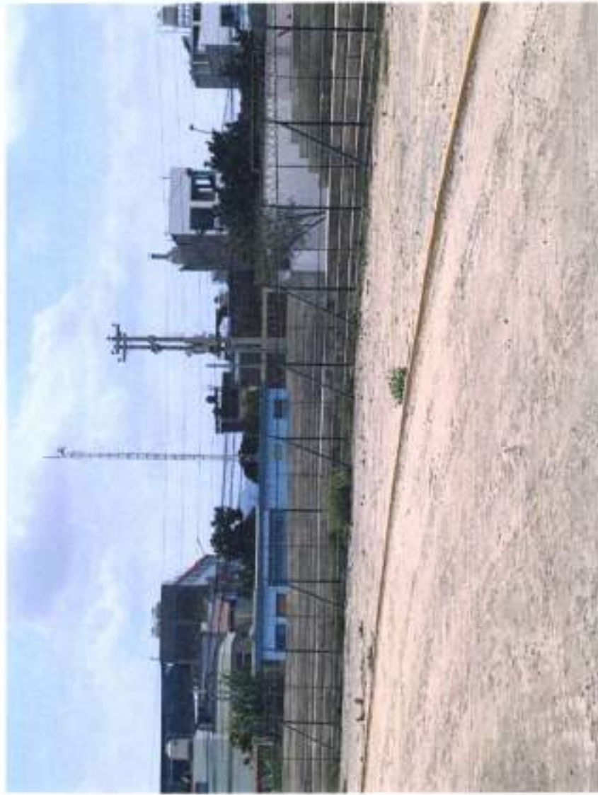
CERCO PERIMETRICO CON MALLA COCADA