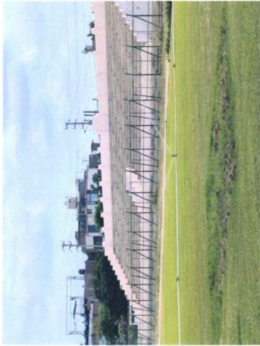
CERCO PERIMETRICO CON MALLA COCADA