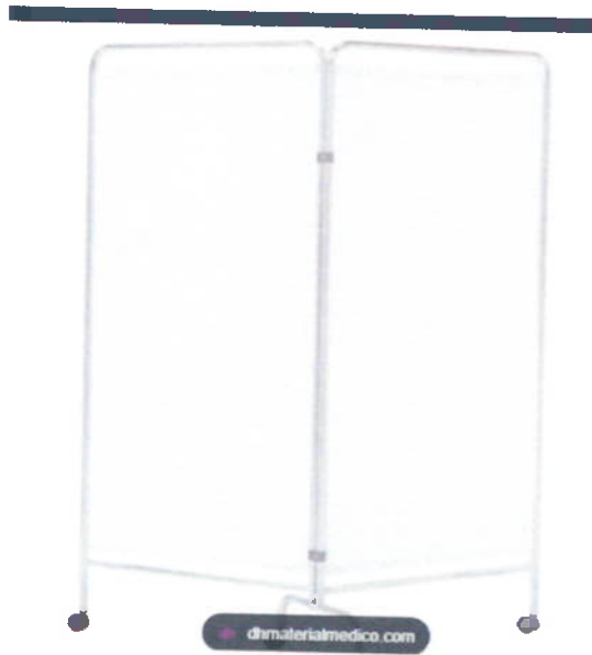
BIOMBO DE METAL DE 2 CUERPOS