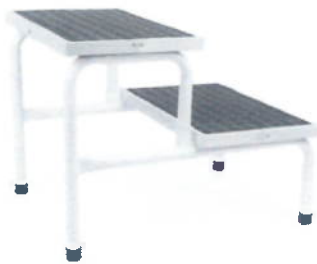
ESCALINATA DE 2 PELDAÑOS