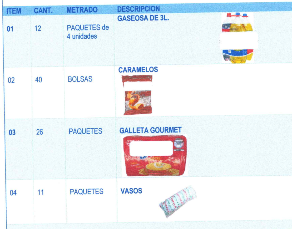
CUADRO N° 01