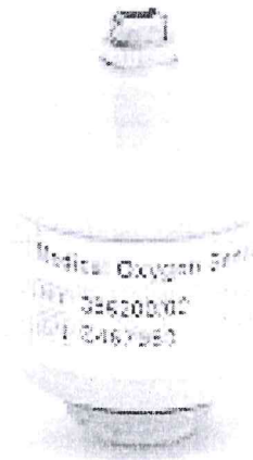
IMAGEN DE SENSOR DE OXIGENO

Es cuanto informo y espero la respuesta.