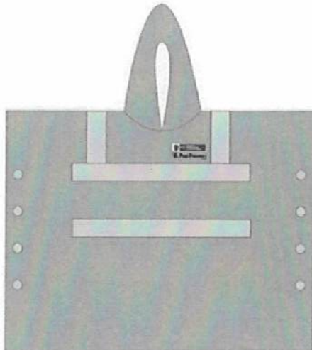
N° 1: de frente (frontal).