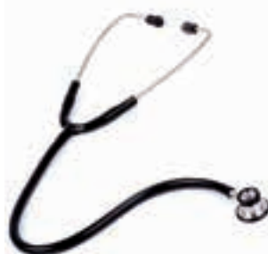
IMAGEN ES SOLO REFERENCIAL