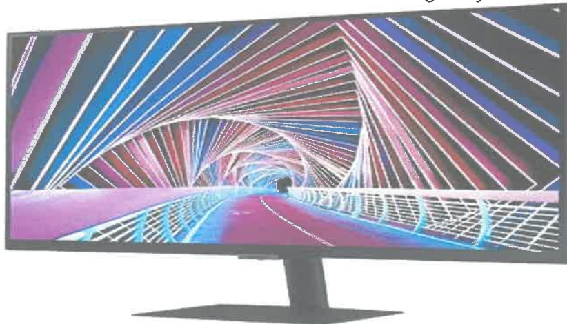
Imagen referencial *

(* La imagen es referencial y no condiciona la oferta del proveedor, siempre que se cumplan las características técnicas mínimas establecidas.