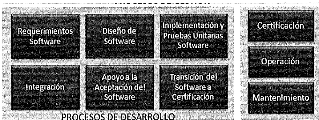
Ilustración. Metodología para el Ciclo de Vida del Software - BN

Los procesos principales de la "Metodología para el Ciclo de Vida del Software" son los que a continuación se grafican: