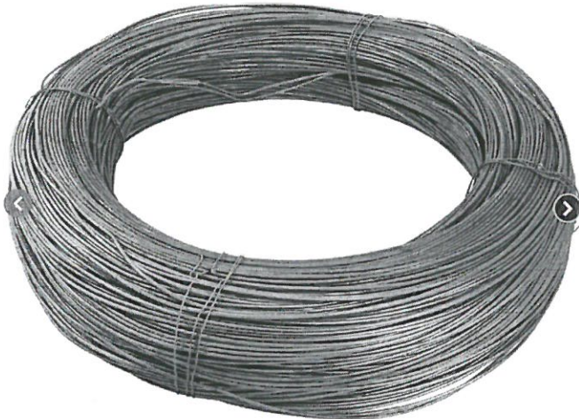
IMAGEN REFERENCIAL ALAMBRE NEGRO RECOCIDO N° 08