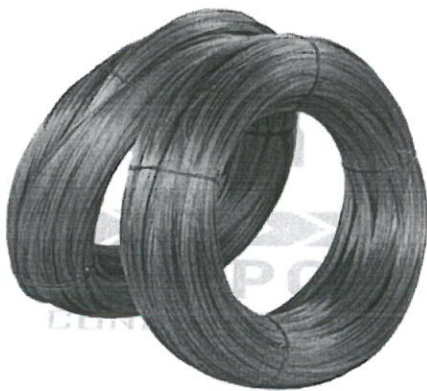
IMAGEN REFERENCIAL ALAMBRE NEGRO RECOCIDO N° 16