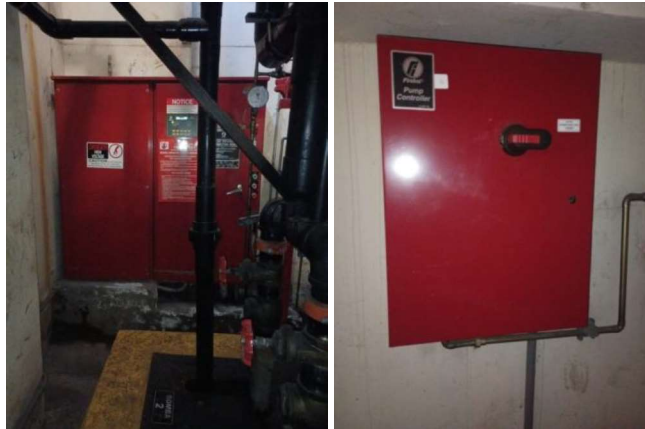
Imagen – Tablero de control bomba principal y jockey del lado norte.