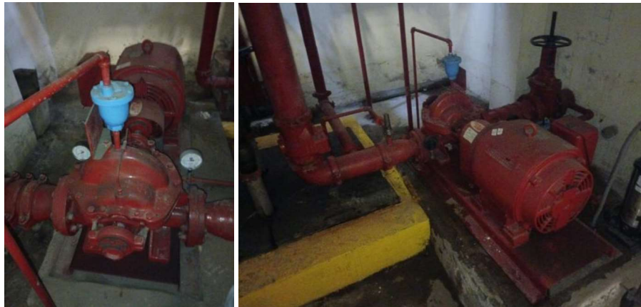
Imagen – Electrobomba principal del lado sur y norte.