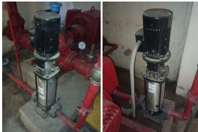
Imagen – Electrobomba jockey del lado sur y norte.