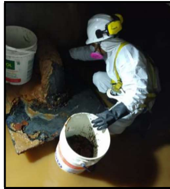
Imagen N°01.- Mantenimiento de cisterna.

La actividad consistirá en el mantenimiento preventivo de los tramos y accesorios de tuberías que se encuentran expuestas en el interior de la cisterna. Se deberá quitar la presencia de óxido y se realizará el tratamiento de pintado respectivo. Incluye mantenimiento preventivo a los sensores de nivel que existieran en el interior. Se deberá eliminar toda partícula que obstruyan las tuberías.