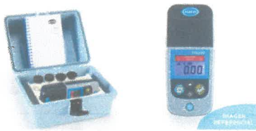
❖ Imagen referencial