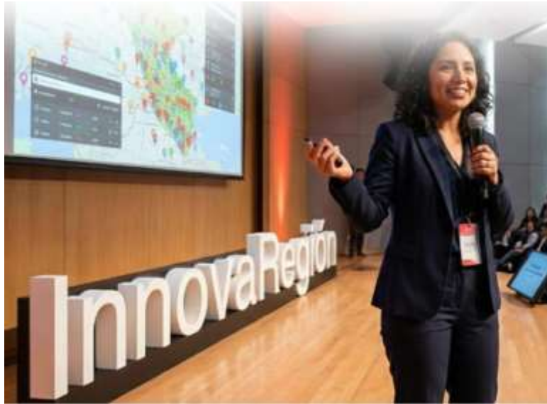
Imagen referencial N°01