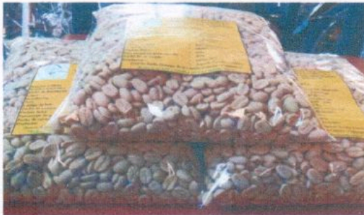
Presentación en bolsa de 1.0 kg.).