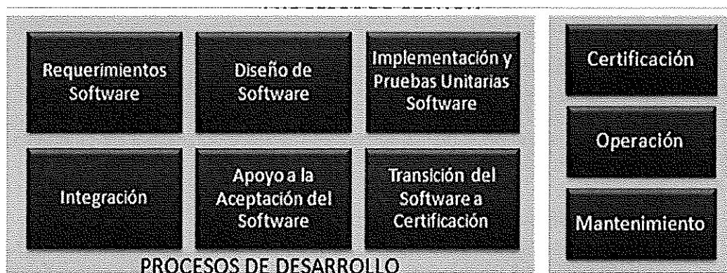
Ilustración. Metodología para el Ciclo de Vida del Software - BN

Los procesos principales de la "Metodología para el Ciclo de Vida del Software" son los que a continuación se grafican: