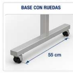
BASE CON RUEDAS

Barra horizontal inferior y/o arco de refuerzo entre parantes.