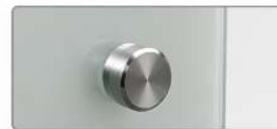
Perno de soporte