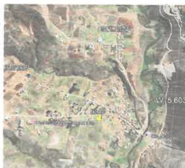
Imagen de ubicación de zona a intervenir

El proyecto contempla REPARACION DE CAPTACION DE AGUA DE 60 M2, CONSTRUCCION DE LINEA DE CONDUCCION DE 4,175.01 M Y CONSTRUCCION DE RED DE DISTRIBUCION DE 3,816.00 M.