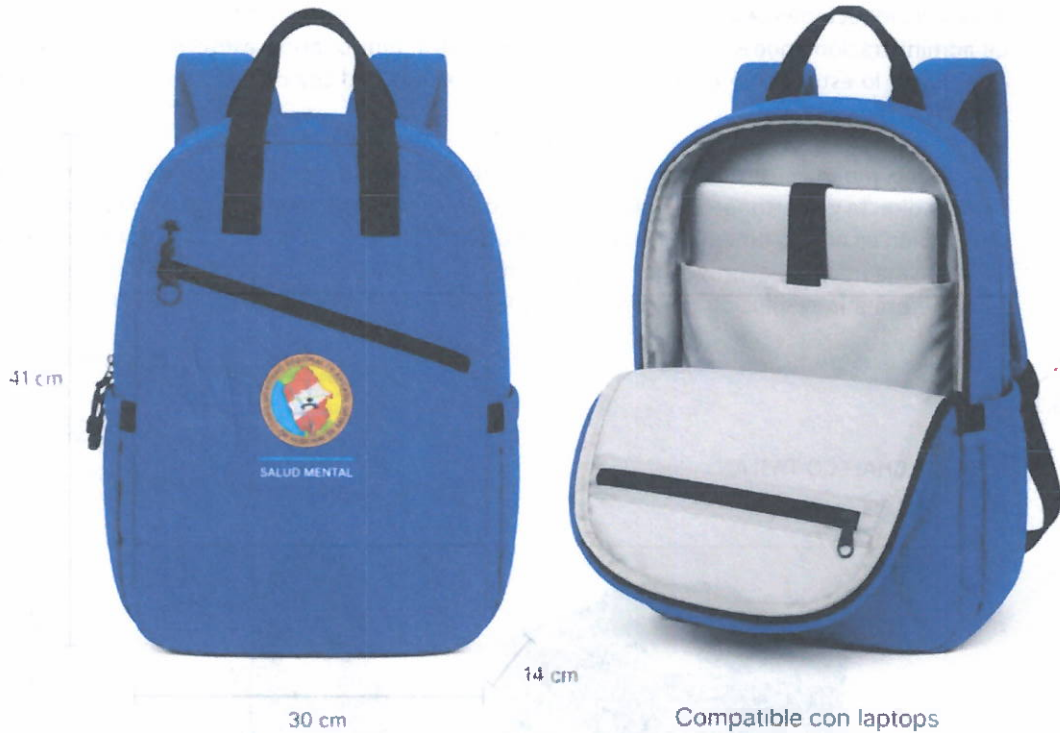
IMAGEN DE LA MOCHILA

“AÑO DE LA ESPERANZA Y EL FORTALECIMIENTO DE LA DEMOCRACIA”