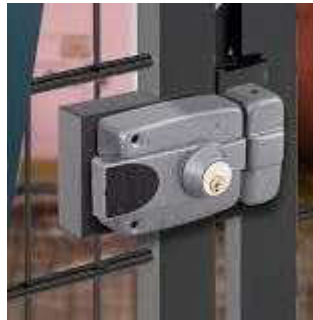
Imagen 3. Imagen referencial de la cerradura interna y externa.