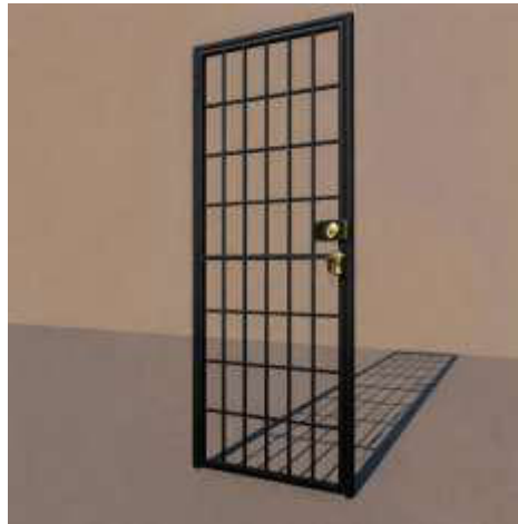
Imagen 1. Imagen referencial del protector interno

El material de ambos protectores será de fierro negro fundido, con un marco de 1/8 de espesor y planchas de 2 mm. El protector interno contará con un pestillo de oreja por debajo de la cerradura, para el uso de un candado. El protector externo contará con tres pestillos de oreja para el uso de un candado, uno superior, uno inferior y uno en medio. Ambos protectores contarán con una cerradura tipo night latch de sobreponer.