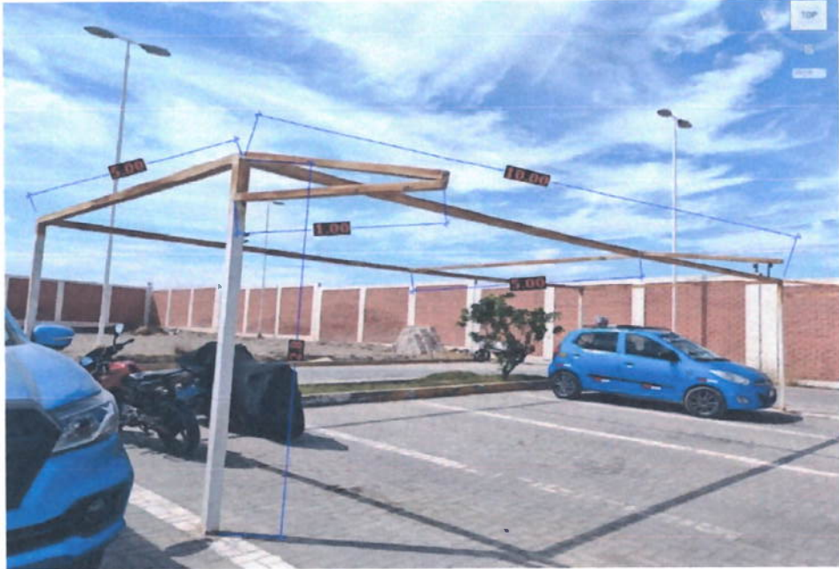
En total se tiene 6 áreas de parqueo como el de la foto con las mismas medidas