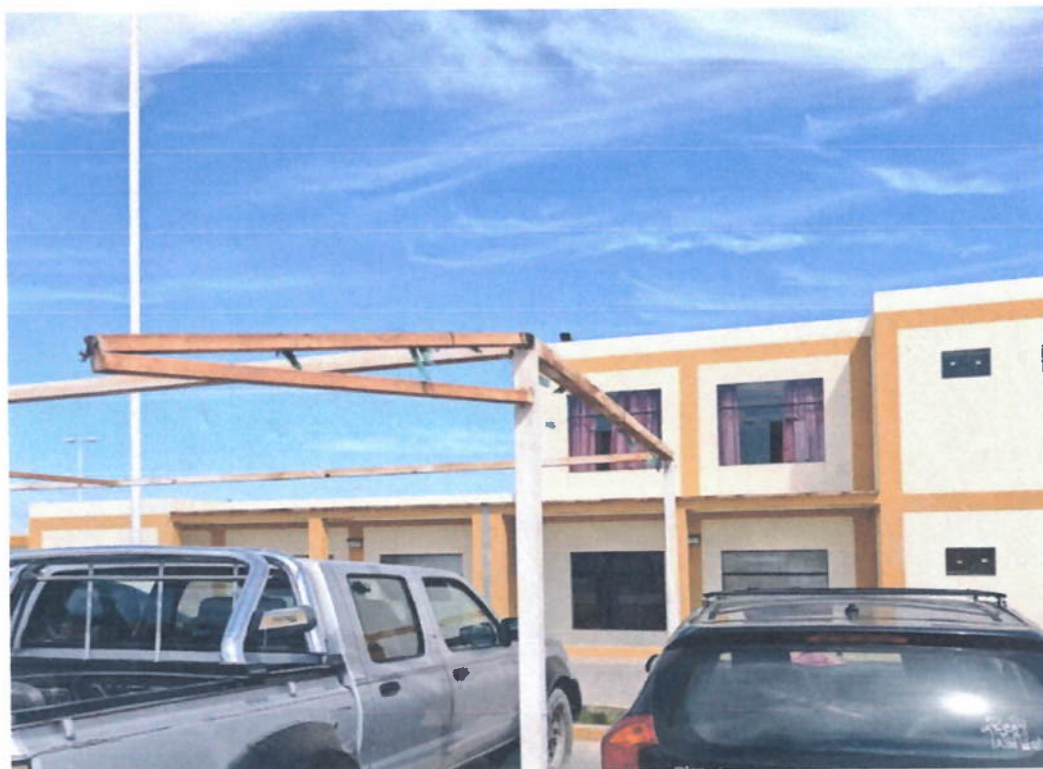
Estructuras a ser removidas por el daño que sufrió