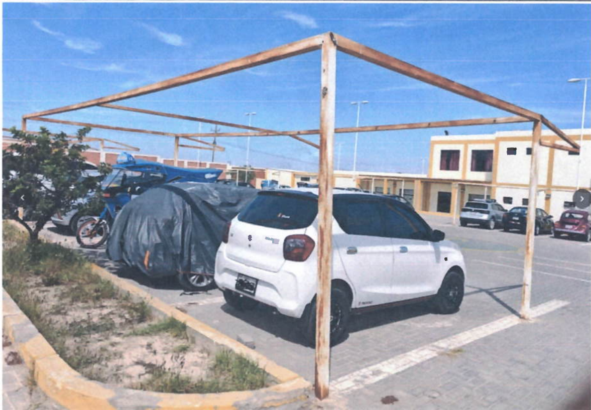
Estructuras de metal a ser lijadas, pintadas para su posterior colocación con malla raschel y colocación de 2 patas adicionales en los centros de dicha estructura, para su sostenimiento.