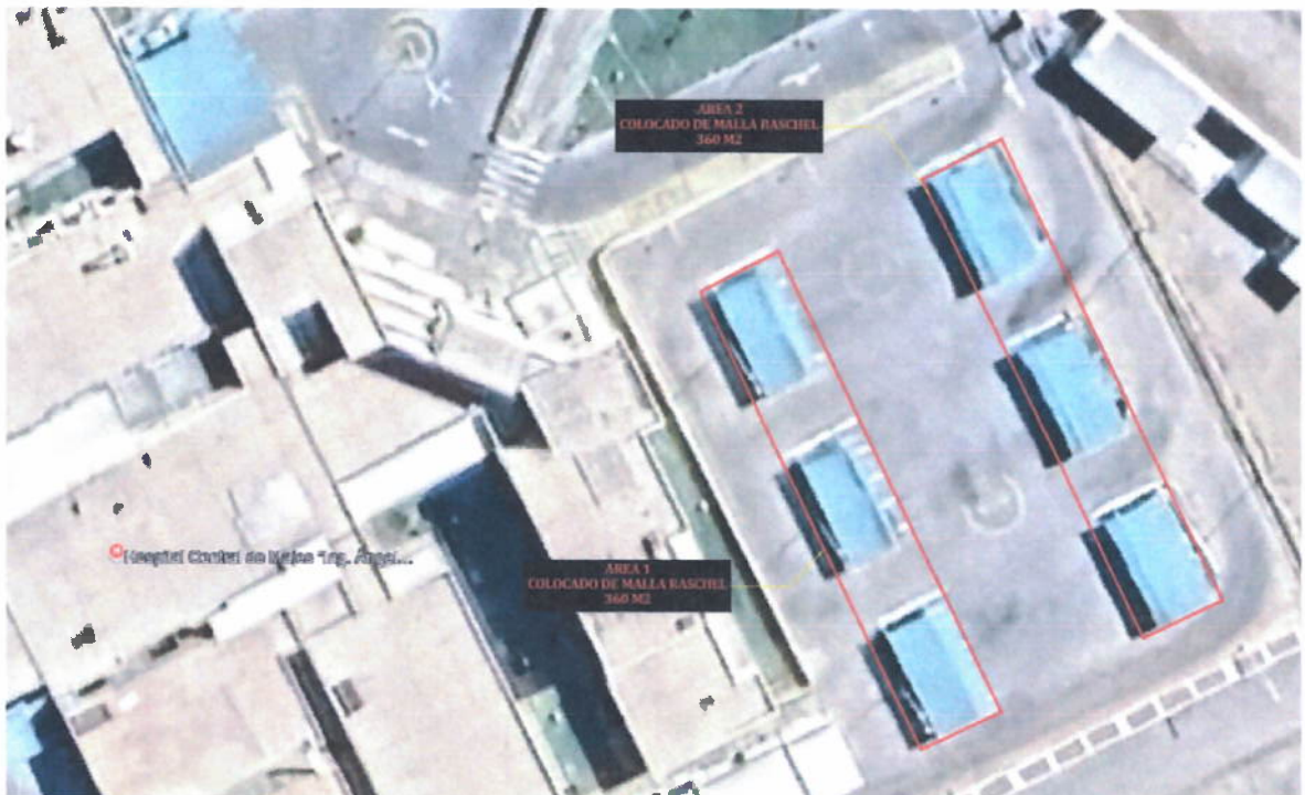
AREA 1 Y AREA 2, de esta forma serán instaladas las mallas raschel.

GOBIERNO REGIONAL DE AREQUIPA GERENCIA REGIONAL DE SALUD HOSPITAL CENTRAL DE MUJERES