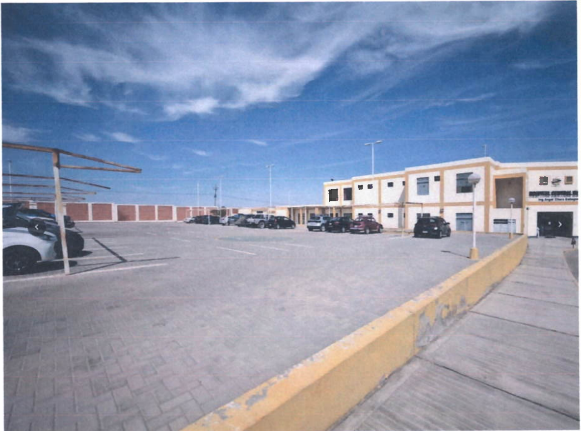
Patio de Parqueo de Vehículos, las estructuras están en mal estado y sin cobertor

GOBIERNO REGIONAL DE AREQUIPA GERENCIA REGIONAL DE SALUD HOSPITAL CENTRAL DE MAJES