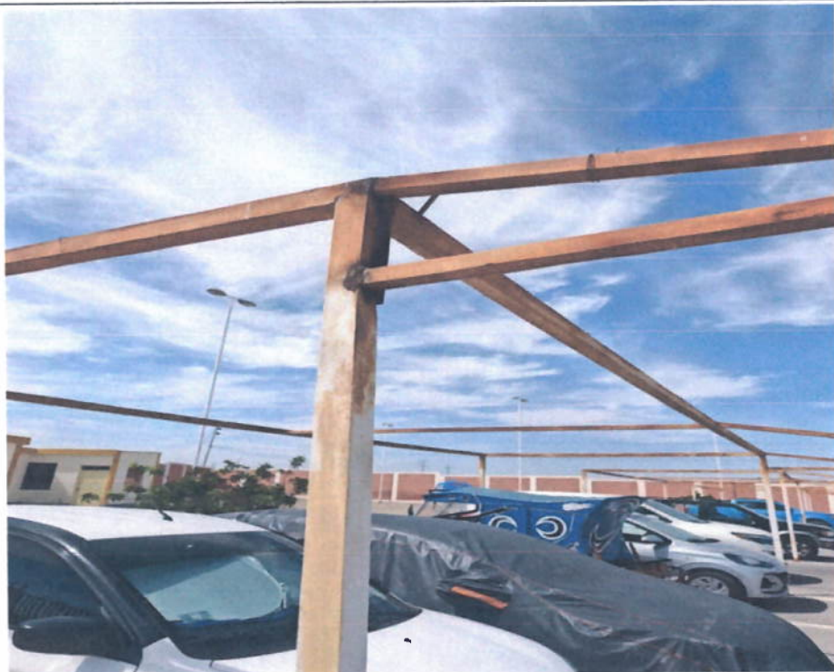
Puntos donde es necesario el cambio de la estructura por la gran cantidad de corrosión, ya que esto puede llegar a desprenderse y ocasionar algún accidente o daño material.