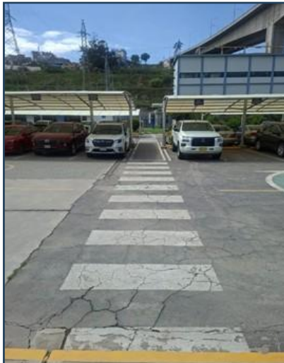
Imagen 01: Imagen estado actual