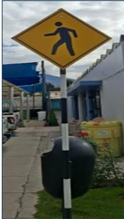
Imagen 13: Imagen referencial de la señalética a confeccionar e instalar