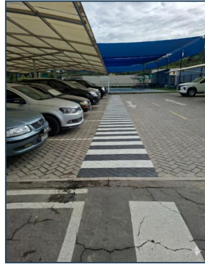
Imagen 06: Resultado final (Las dimensiones son referenciales)