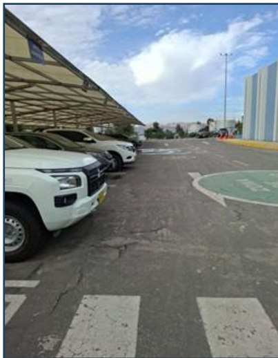
Imagen 11: Imagen estado actual