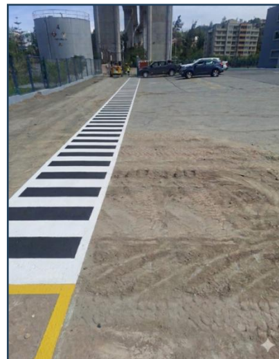
Imagen 04: Resultado final (Las dimensiones son referenciales)