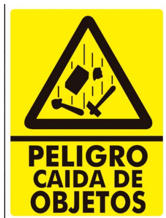
Imagen 14: Imagen referencial de la señalética a confeccionar e instalar