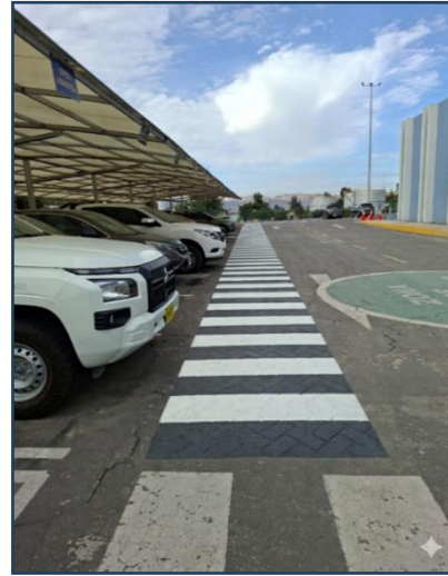
Imagen 12: Resultado final (Las dimensiones son referenciales)