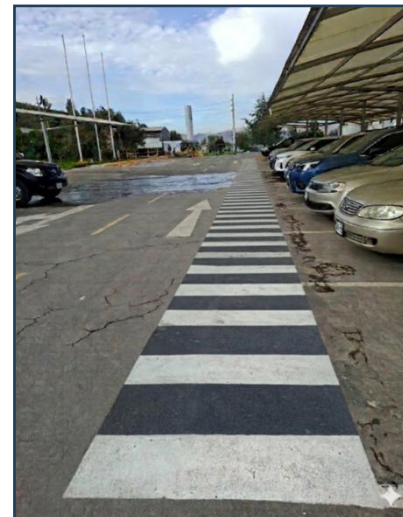
Imagen 08: Resultado final (Las dimensiones son referenciales)