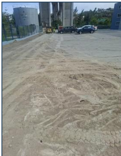
Imagen 03: Imagen estado actual