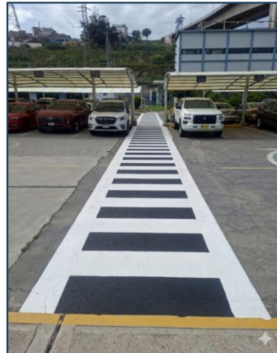
Imagen 02: Resultado final (Las dimensiones son referenciales)