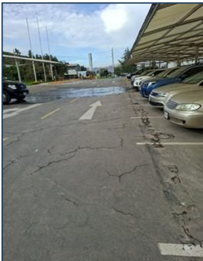
Imagen 07: Imagen estado actual