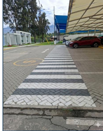
Imagen 10: Resultado final (Las dimensiones son referenciales)