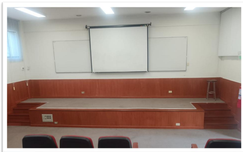
Imagen Referencial de Escenario Existente