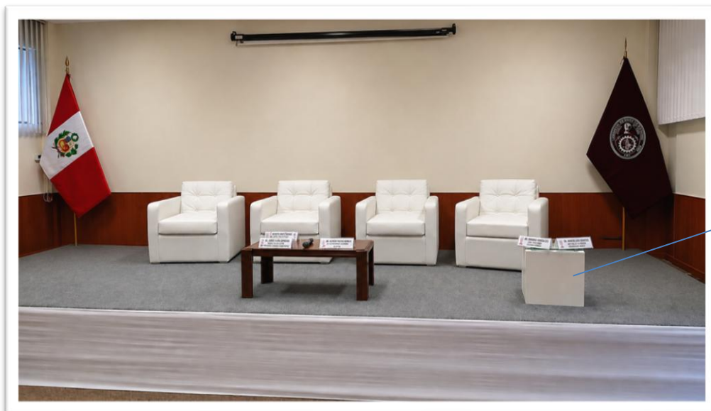
Imagen referencial de sillones y mesa