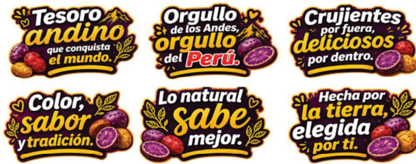
Imagen referencial 04: diseño de paneles tipo Celtex de 60 cm x 30 cm