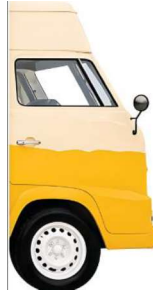
Imagen referencial 03: diseño de cabina del truck banner de 1.20 m x 1.80 m