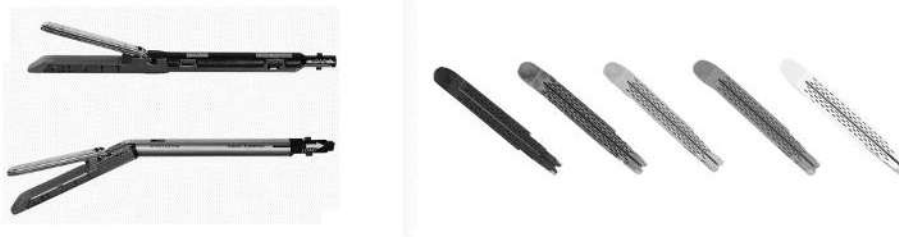
Fig 1.: Recarga para grapadora quirúrgica endoscópica lineal cortante (Imagen referencial)