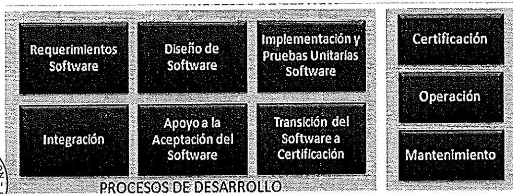
Ilustración. Metodología para el Ciclo de Vida del Software - BN

Los procesos principales de la "Metodología para el Ciclo de Vida del Software" son los que a continuación se grafican: