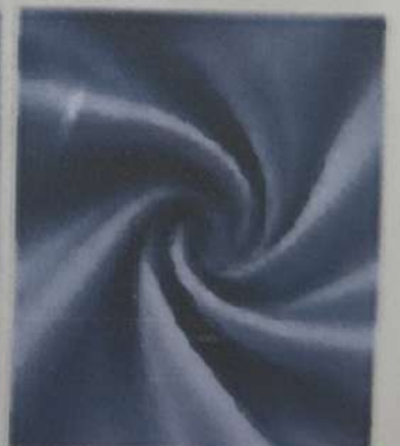
TELA SEDA SATINADA