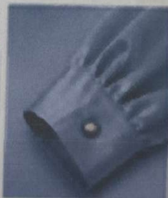
PLIEGE CON BOTÓN