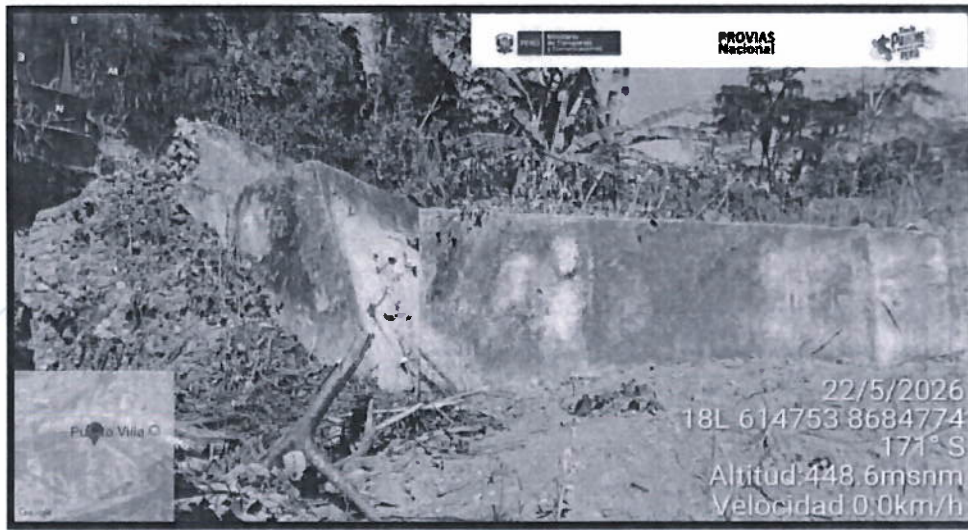
Imagen 01: Muro 3.80m*3.20m*7.60m.