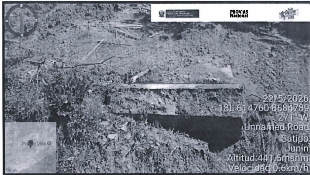
Imagen 02: Zapata 2.00m*4.30m*8.00m.