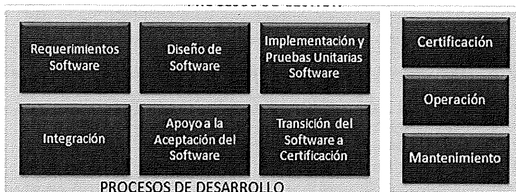
Ilustración. Metodología para el Ciclo de Vida del Software - BN

Los procesos principales de la "Metodología para el Ciclo de Vida del Software" son los que a continuación se grafican: