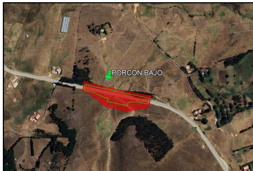
Ilustración 1 Ámbito del levantamiento de información. Porcon Bajo