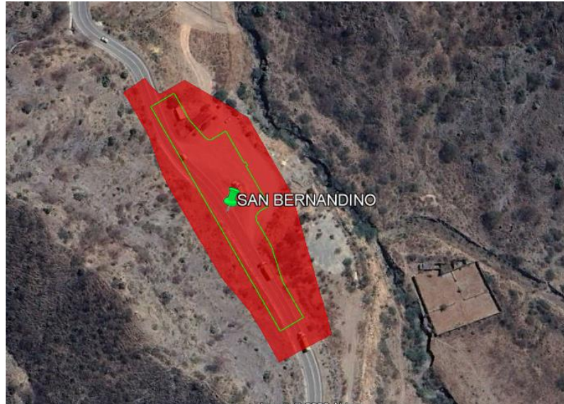
Ilustración 2 Ámbito del levantamiento de información. Peaje San Bernardino

“Decenio de la Igualdad de Oportunidades para Mujeres y Hombres” “Año de la Esperanza y el Fortalecimiento de la Democracia”