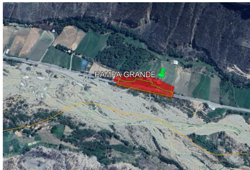
Ilustración 3 Ámbito del levantamiento de información. Peaje San Bernardino

NOTA: El proveedor adjudicado en el presente servicio, deberá visar obligatoriamente documentos y cuadros proyectados que elabore, ello en señal que el documento ha sido examinado y considerado válido.