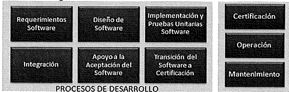
Ilustración. Metodología para el Ciclo de Vida del Software - BN

Los procesos principales de la "Metodología para el Ciclo de Vida del Software" son los que a continuación se grafican: