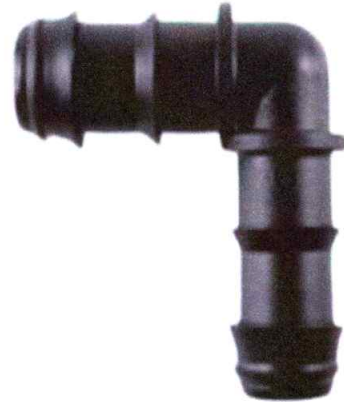
Codo de tubo HDPE 32mm (1")