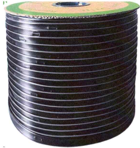
Cinta para riego por goteo 16mm (m)