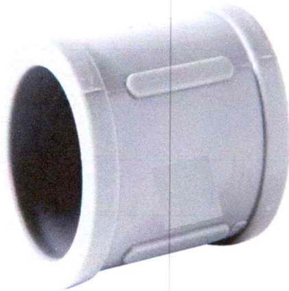
Unión PVC mixta 1/2" rosca interna