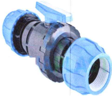
valvula de enlace HDPE de HDPE (1") rosca interna