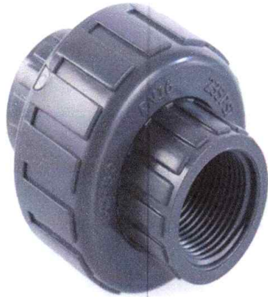
Unión universal 1" rosca interna