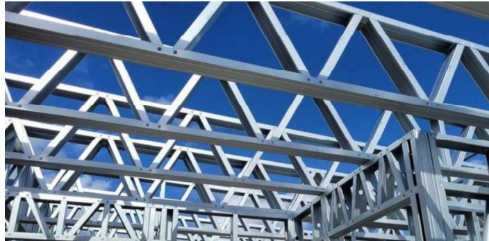
Imagen 1: imagen referencial.

Comprende el suministro, fabricación, habilitado e instalación de cobertura liviana conformada por estructura portante de acero galvanizado mediante perfiles tipo parante de 89 x 38 x 0.45 mm y riel de 89 x 38 x 0.45 mm , incluyendo elementos de rigidización, uniones, fijaciones, cobertura, accesorios, mano de obra, herramientas, equipos y todos los materiales necesarios para su correcta ejecución y funcionamiento.