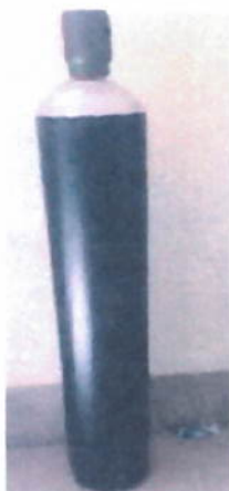
IMAGEN REFERENCIALES: Cilindro de 9 m 3 de aire medicinal.