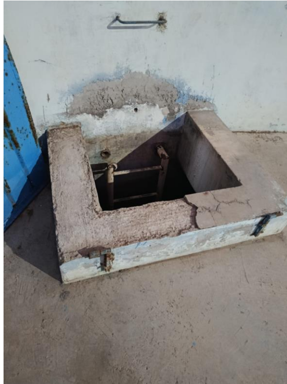
Imagen 1: Marco De Concreto Deteriorada