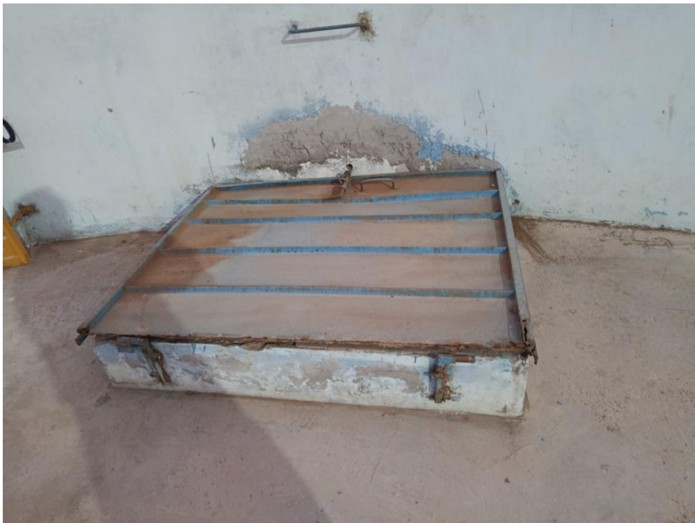
Imagen 2: Tapa Oxidada