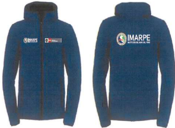
PARCHES A COLOCAR EN CASACA

“Decenio de la Igualdad de Oportunidades para mujeres y hombres” “Año de la Esperanza y el Fortalecimiento de la Democracia”