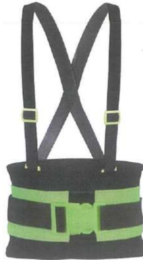
IMAGEN REFERENCIAL A

“Decenio de la Igualdad de Oportunidades para mujeres y hombres” “Año de la Esperanza y el Fortalecimiento de la Democracia”