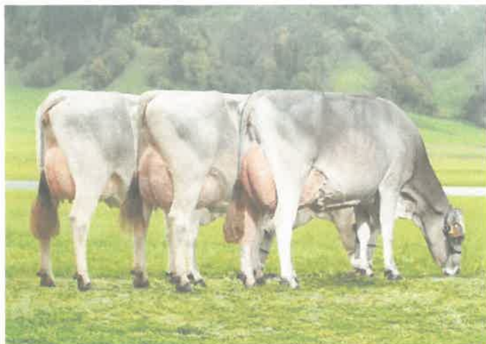
M: swissgen Mane Sg HADLEY SG, GM: Bleicki Genetic Huge Sg HAILEY, UGM: Bleicki Genetic Fact FANTASIE