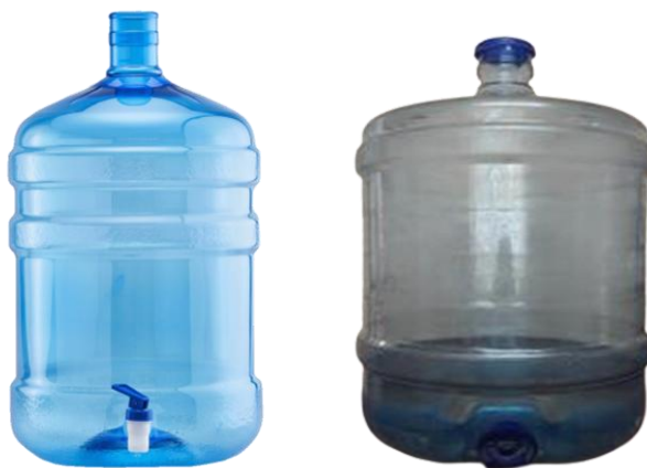
Botellón con caño o Botellón con válvula dispensadora

“Las características técnicas, serán acreditadas mediante Fichas, catálogos u otro documento emitido por el fabricante o representante del producto objeto de la contratación, de forma tal que acredite las características técnicas, de corresponder”.