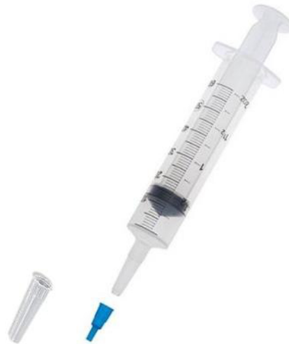
Fig. 2: Jeringa descartable punta catéter sin aguja (no incluye diseño)