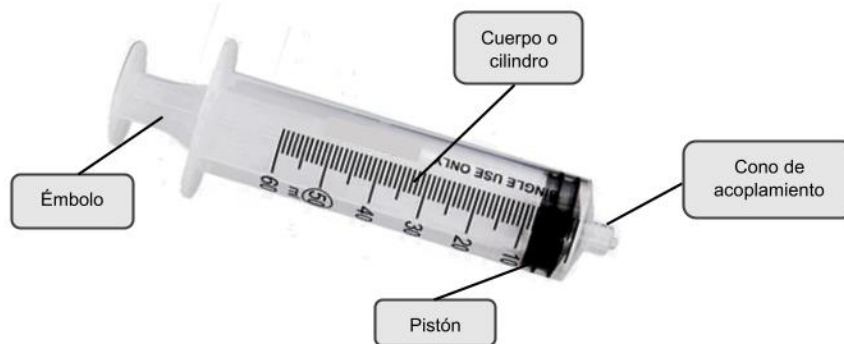
Fig. 1: Jeringa descartable con Luer Lock sin aguja (no incluye diseño)

IETSI - ESSALUD DIRECCIÓN DE EVALUACIÓN DE TECNOLOGÍAS SANITARIAS SUBDIRECCIÓN DE EVALUACIÓN DE DISPOSITIVOS MÉDICOS Y EQUIPOS BIOMÉDICOS