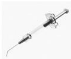
Fig. 1.: Hialuronato (sódico)+ condroitin sulfato 3% + 4% solución viscoelástica (no incluye diseño)